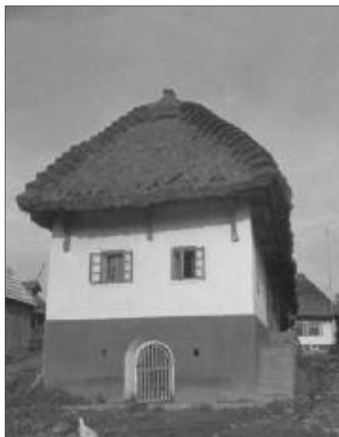
Obr. 05: Cerovo, zřejmě 1953, gazdovstvo, elektrifikace.