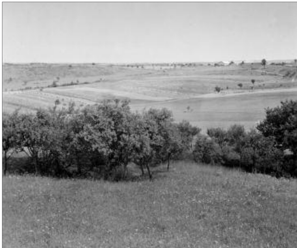
Obr. 7: Cesta k cerovským lazům.