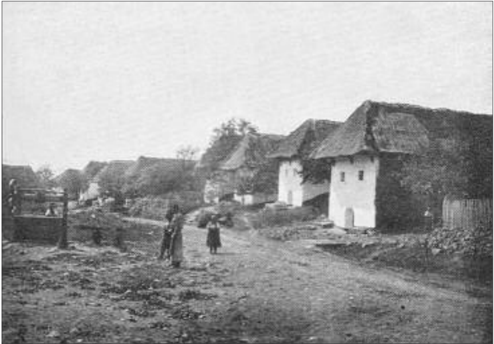
Obr. 03: Cerovo 1905 řadová náves s těsným sousedstvím usedlostí s valbovou doškovou střechou.