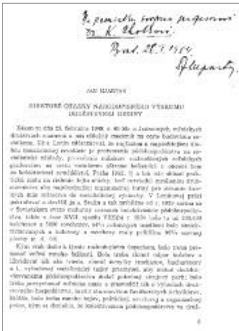
Obr. 09: Mjartan Družstevná dedina, dedikace K. Ch., Slovenský národopis z roku 1952.