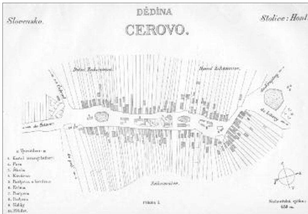
Obr. 02: Cerovo 1904, katastr.

la na venkov, především na Tatry, středoslovenské podtatranské stolice a moravsko-slovenské pomezí. Osobní kontakty ponejvíce spočívaly v návštěvách martinského centra na Turci a v příhraničních stolicích, především v okolí Skalice a Holíče, případně na Trenčínsku či Oravě. Vždyť i Rudolf Pokorný se při svých „potulkách“ ve stopách rejsů Prokopa Holého po pobytu v Kremnici a Banské Štiavnici odhodlal na Hontu pouze ke krátkému výjezdu do Prenčova a v doprovodu Andreje Kmetě k výstupu na Sitno. Jižněji po proudu Litavy přes vrchy k uherské nížině, do oblasti „už polo-zmaďařené“, pouze nostalgicky shlédl z vrcholu někdejšího vulkánu. Povšechné údaje o regionu pak vypsál z dostupných zdrojů (Pokorný, 1883: 236–250; zejm. 246) a ani jeho komentář k cestám po hontské stolici nebyl právě doporučující: „(...) není tu zrovna bezpečno. Stoliční úřad proslaven jest pouze volební kořalkou. Nedávno byla tu mezi obcemi Hont a Drégely-Palankou konečně chycena celá lupičská rota, čítající 32 hlav!“ (Pokorný, 1883: 235).