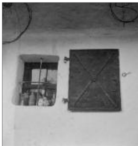
Obr. 15: Cerovo, 1953, železná okenice a okno.