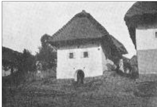
Obr. 04: Cerovo 1905, gazdovstvo.

hlubší setkání s jevy přežívajících starších tradic, jejichž kvalitu a původ se učil hodnotit v tradičních písemných a hmotných pramenech, s nimiž se setkával v Zíbrtových a Niederlových přednáškách, a dost možná již i na základě četby prací Edwarda Burnetta Tylora, jež se později staly východiskem jeho pojetí národopisného bádání v duchu odhalování a interpretace tzv. přežitků ( survivals ) (Ducháček, 2016: 40–44). Definitivně si zde uvědomil, že pokud má národopisná věda vůbec pochopit objekt svého bádání, nesmí se omezovat na literární prameny a materiál, zprostředkovaný laickým sběrem (a nezděděnou již staršími sběrateli přizpůsobovanou měšťanské recepci), nýbrž musí jít do terénu a snažit se pronikat do mentality a specifík prostředí, jež zkoumá. I když rozsah požadavků, jež si takto stanovil, počal do důsledků chápat až mnohem později, během cerovského pobytu se Chotek poprvé narazil na úskalí laiky zprostředkovaných informací a sběru materiálu z druhé ruky: „Materiál se musí ověřit a pamětníky je nutno kontrolovat. Každý, kdo se ptá, musí vědět, zda ten, jehož se ptá, mu říci pravdu chce, dovede a může“ (srov. Vomlelová, 1968: 40n; k aktuální reflexi této maximy Denková, 2016: passim).