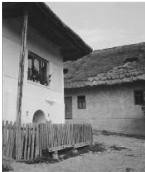
Obr. 14: Cerovo, 1953, trojkno.

a pražských posluchačů, po roce 1949 prostřednictvím marxistických, či spíše stalinských floskul odsuzovala jako buržoazní, a proto nehodné následování (srov. např. Smetánka, 1988; Smetánka, 2004: 59, 83, passim; Chotek, 1966; ke generačnímu a „metodologickému“ zlomu v oboru po roce 1949 stručně Ducháček, 2016: 38–44).