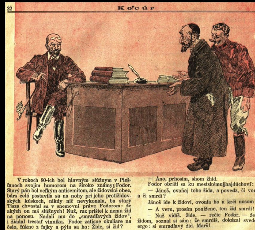
Obr. III. 15. 3 autor ilustrácie: nezistený. Kocúr , 1919, 3: 22.