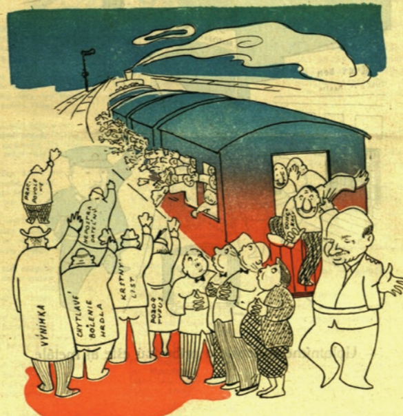
- Preboha, neberte mi môjho jediného dojiča kráv...!

Kocúr vychádza 1. a 15. v mesiaci. Redakcia a administrácia je v Turč. Sv. Martine, telefon 56. Majiteľ a vydavateľ: Vydavateľstvo a nakladateľstvo KOMPAS v Turč. Sv. Martine, zodpovedný redaktor Ján Šimický. Predpláca sa na 24 čísel Ks 50,- do cudziny Ks 100,-. Jedno číslo stojí Ks 2-50. Kto si ponechá dve za sebou číslo časopisu, pokladá sa za riadneho preplatiteľa. Rukopisy sa nevracajú. Používanie súvisných známok povolené Ministerstvom dopravy a verejných prác, rezort pošty v Bratislave pod číslom 122.264-III/1.-1946. Všetkým komisárňam expeduje novinarstvo Štefan Šrobár, Bratislava, Laurinská 14. Tlačou Kultúrneho občianskeho spolku v Turčianskom Sv. Martine. Dohľadací poštový úrad v Turčianskom Sv. Martine.