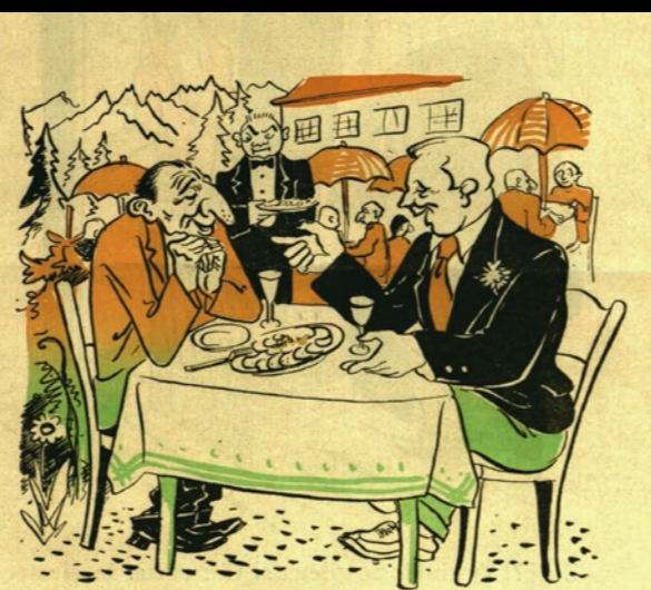
- Veď sa už len neboj, Móric, tú výnimku ti ja vykonám. Veď si ty dôležitý, lebo jeden z nás dvoch pracovať musí, a ja veru času na ťo nemám...