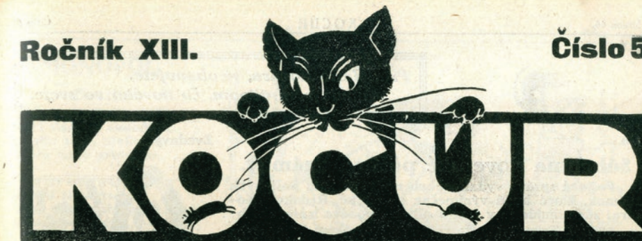
Obr. III. 15. 16 „Čigáni, čigáni, nebice še...“, autor ilustrácie: neuvedený. Kocúr, 1935, 5: 65.