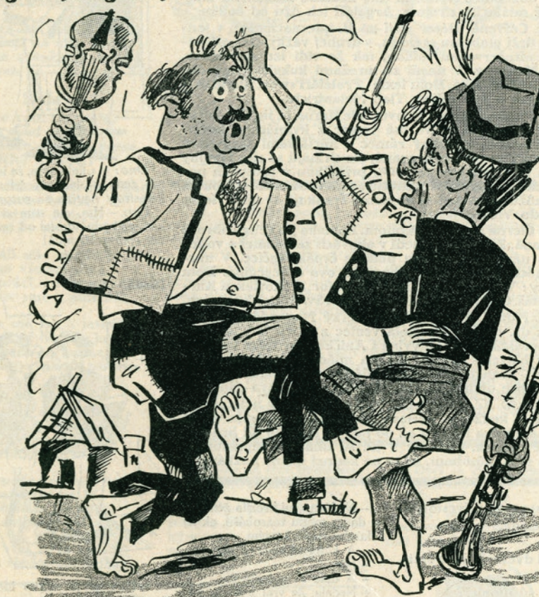
C. T. K. (cigánska tlačová kancelária) oznamuje: Nie je pravda, že „še čigáni bili o perine“, ale je pravda, že še fšovajda Mičura a „vrchní“ dáde Klofáč bili o cigánske hlasy vo voľbách!